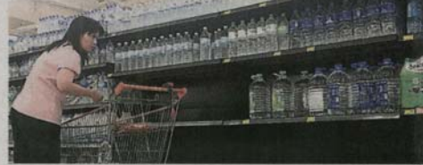
■为免无水饮用，主妇们当然要大量购入矿泉水以防万一。

据了解，50%的受影响地区预计将会在24小时内逐步获得水供，如沙亚南、八打灵、鹅唛区内的指定地区。提升工程是在24日早上9时进行，耗时14小