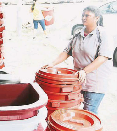
巴生与沙亚南一带商家在上周五（19日）就开始忙于售卖各大水桶，忙得不可开交。