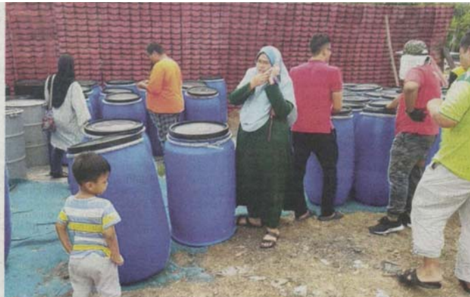
ORANG ramai memborong tong air di pusat Jualan Tong Drum 7, Kampung Padang Jawa, Selangor, semalam.