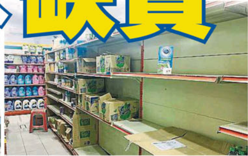
各大超市因矿泉水被扫空，急于下单订货