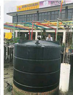
商家早已预备大水桶应变，由于在抢购过去常面对制水的问题，因此部分的民众已备好大量的水来应对大制水。