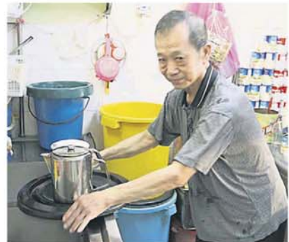
业者忙着装净水入桶内备用。

雪兰莪水务管理公司 (Air Selangor) 将于本月 24 日 (星期三) 改善雪兰莪河第二期滤水站 (SSP2) 的供电系统，因此该滤水站暂停操作，估计有 577 个地区 414 万 3465 名用户