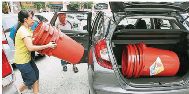
由于担心制水期超过86个小时，部分民众一次购入逾10个水桶蓄水。