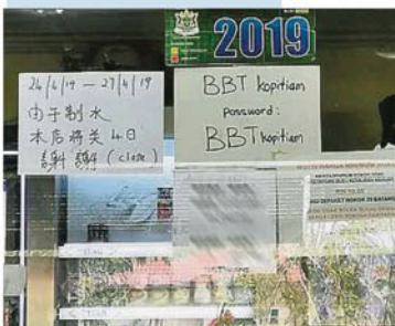
巴生一些餐饮店张贴通告宣布制水期间停业。

“我校昨日（22日）已通过各项管道，包括手机微信群组和学校网页等，通知学生和家长们有关制水本周五停课一天的消息，相信大家已知悉。”