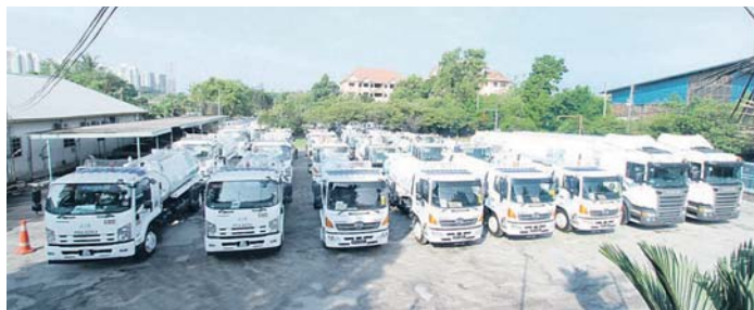
Lori tangki Air Selangor siap sedia menghantar bekalan air kecemasan kepada pelanggan.

Air Selangor menyelaras sepuluh Pusat Khidmat Setempat (PKS) di beberapa lokasi untuk memberikan bantuan kepada pelanggan yang terkesan akibat gangguan bekalan air berjadual bermula hari ini.