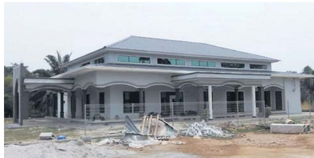
Dana sumbangan orang ramai dan badan korporat prihatin diperlukan untuk menyiapkan projek pembinaan semula surau SMK Seri Tanjung yang sebelum ini musnah dalam kebakaran tiga tahun lalu.

R M100,000 dana sumbangan diperlukan untuk kerja baik pulih fasa terakhir surau Sekolah Menengah Kebangsaan (SMK) Seri Tanjung yang musnah dalam kebakaran tiga tahun lalu.