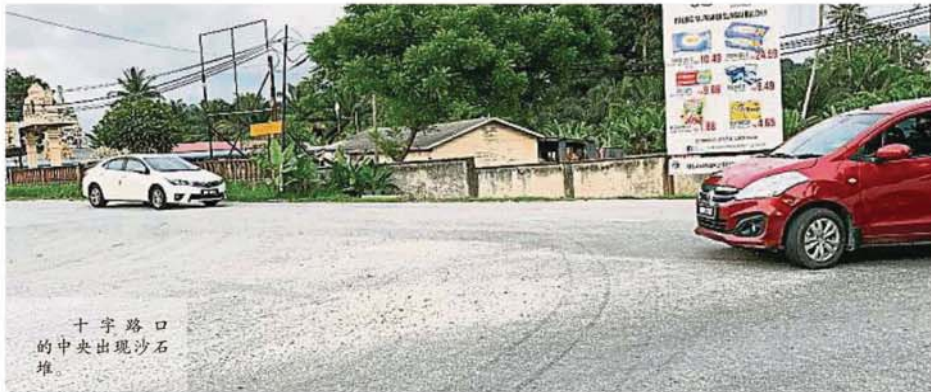
十字路口 的中央出現沙石 堆

Provided for client's internal research purposes only. May not be further copied, distributed, sold or published in any form without the prior consent of the copyright owner.