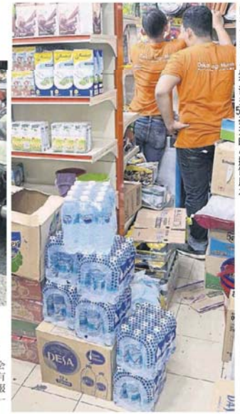
■在一些商店还有许多500毫升的小瓶饮用水。

无论如何，上述情况只是发生在一些区域，还有一些商店的5公升饮用水还是有货源，暂时没有发生断货的情况。