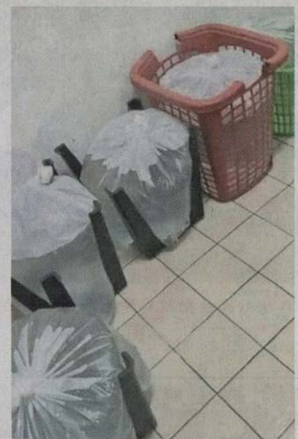
■商家在制水期间各出奇招，为解决水桶占位和恢复水供后“无用武之地”情况，一些商家干脆以塑料袋装水备用，形成这幅“奇景”。

他表示，雪州水供公司出动水槽车到缺水严重的地区派水是好的，但希望往后的制水能分阶段进行，勿牵涉太广泛地区。(TKM)