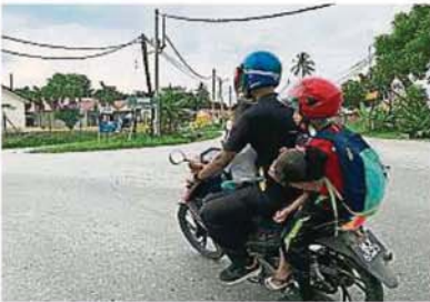
一名载着多名学生的家长为了闪开沙石而導致摩托傾斜。

轰埠新村过去多年来遭数家采石场围绕，运载沙石的数十辆罗里每日川流不息，采用村口的B29拉贡州际公路通往万挠和双溪毛糯等地。