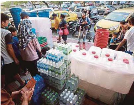
Orang ramai membeli tong air di sebuah kedai di Seksyen 19, Shah Alam, semalam.

Shah Alam: Penduduk di Shah Alam dan Klang bersiap sedia menghadapi gangguan bekalan air, susulan kerja penambahbaikan perkakasan kritikal sistem bekalan elektrik di Loji Rawatan Air Sungai Selangor Fasa 2 (LRA SSP2) hari ini.