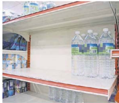
■在一些商店，目前还有一些1.5公升的饮用水。

断水时间太久的话，会通知顾客，拿衣服的时间可能要延后一至两天，如果是一般的承包洗衣服务，业者会去寻求同业的协助，尤其是一些还有水供的同业，因为如果是承包洗衣服务，有关衣物或送洗物都必须要在一定时间内完成和送回。