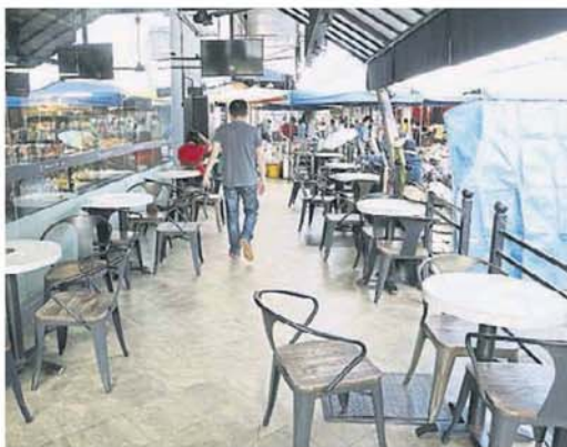
虽然灵市政厅不允许餐饮业店业者将桌椅摆在店外的范围,可是还是有业者无遵守。

针对市政厅不允许餐饮业者摆放桌椅在外,消费者认为,市政厅可考虑让业者桌椅都摆在外,前提是必须保持环境卫生;也有者认为,市政厅更应对霸占泊车位摆档的非法小贩,而非仅摆出货物在五角基的合法营业者。