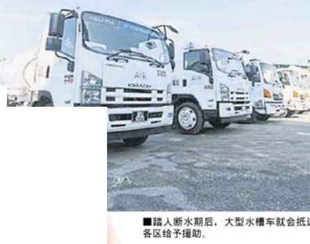
■断水期后, 大型水槽车就会抵达各区给予援助。

雪州水供管理私人有限公司也准备了106个配水箱, 到个策略性地区, 并提供9条水管协助受影响的顾客。在工业区方面, 业者能到吉隆坡的雪州水供管理私人有限公司购水, 同时该公司也会在各地区设置添水站, 让业者们购水应对。民众可在www.syabas.com.my、面子书 "Air Selangor"、推特 @air_selangor 或App "Air Selangor", 查询水供中断的资料。