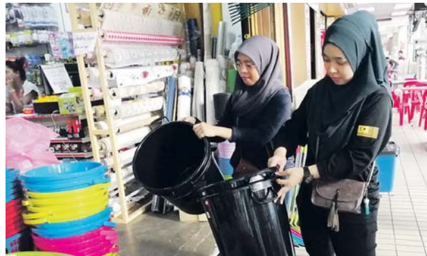
Tong besar menyimpan air habis dibeli pengguna.

"Tong besar sudah habis yang tinggal hanya saiz kecil saja. Tempahan baharu dah dibuat tapi sampai minggu depan," katanya.