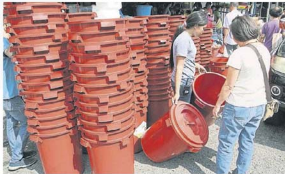
■公众前往购买水桶，以储存食水。