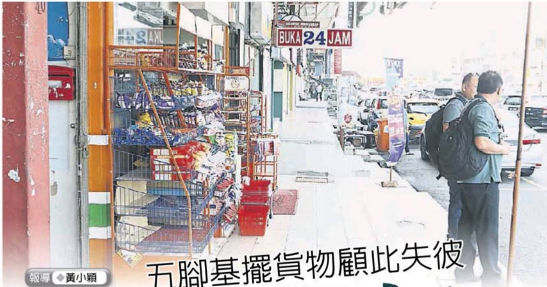
灵市政厅仅允许特定商店商家在店前五脚基摆放物品。