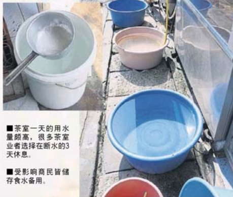
■茶室一天的用水量頗高, 很多茶室業者选择在断水的3天休息。

杂货店业者更看准商机, 增加矿泉水货源, 尤其是大瓶装的矿泉水, 以便届时居民有需要时可以来购买。 “小家庭还算可以应付断水, 有些大家庭用水量高, 储水方面相对的比较难。而且有些家里空间有限, 储水水桶等又很占位, 他们想多储一点水也心有余而不足。” 不管如何, 受访者皆已储存食用, 同时对雪州水供公司提早一星期前通知的表现颇为满意, 因为给了他们心理准备, 也有充足的时间储水。