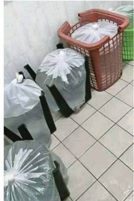
商家在制水期間各出奇招，包括以價格便宜的大塑膠袋裝水備用，形成這幅“奇景”。