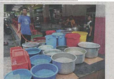
SEORANG pekerja menyimpan bekalan air sebagai persediaan menghadapi gangguan bekalan di Restoran Mirasa di Seksyen 9, Shah Alam semalam.

Gangguan air itu melibatkan enam wilayah iaitu Kuala Lumpur, Petaling, Klang, Shah Alam, Gombak, Kuala Langat dan Kuala Selangor melibatkan 620,835 pemilik akaun atau 4,143,465 peng-