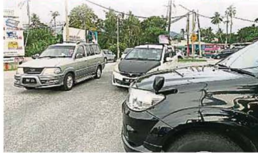
轰埠村口是个十字路口，交通繁忙而混乱，再加上沙石的出现，对各方交通安全构成威胁。