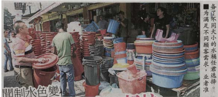
■为满足不同大小的水桶任君选择，业者准