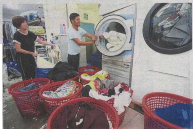
Working overtime: Employees at a laundrette in Sri Hartamas going the extra mile to make sure all laundry is done before the scheduled water disruption.

The manager, who did not want to be named, said the affected branches had