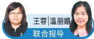
王蓉 | 温丽媚 联合报导

甲洞、八打灵再也23日讯 | 隆雪577地区明起制水，绝大多数地区深受波及，为免临时抱佛脚，许多居民从2天前开始储水、煲水及洗桶，做足准备！