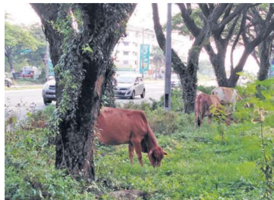
Tindakan pemilik melepaskan ternakan mereka meragut rumput di tepi lebuhraya mengancam nyawa pengguna.

“Harap pemilik ternakan lebih bertanggungjawab supaya tiada nyawa tidak berdosa melayang disebabkan sikap mereka ini,” katanya.