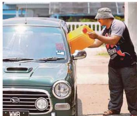
ORANG ramai membeli tong air sebagai persiapan gangguan bekalan air.