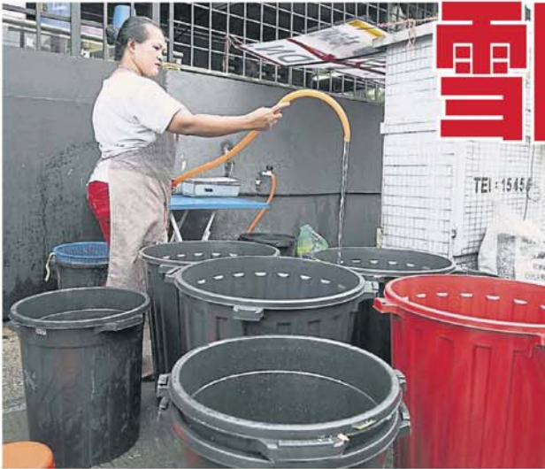
周三开始制水，工人花费不少的时间，为数千个大桶蓄水存放备用。

(吉隆坡 23 日讯) 雪河第二期滤水站 (SSP2) 明日 (周三) 起暂停运作，引发雪隆区水供用户大作战，主妇、商贩忙抢购水桶蓄水备用，卖水桶的忙补货应付惊人需求，但其他领域的生意普遍上或多或少都受影响。