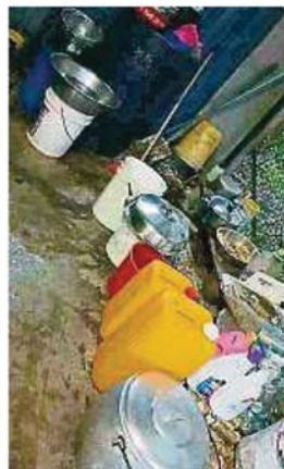
雪隆販商公會聯合會促請同業和民眾在儲水時，應妥善把水桶蓋好，以免孳生子繁殖黑斑蚊。

基於制水期間人們少在家煮食而出外用餐，使得餐飲業生意火紅，他亦促請餐飲同業多關注衛生狀況，若真的不够用水，寧寧可選擇停業。