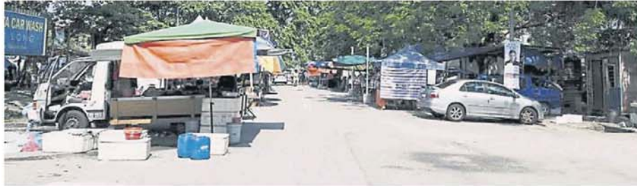
目前在大路旁摆卖的双溪龙早市。