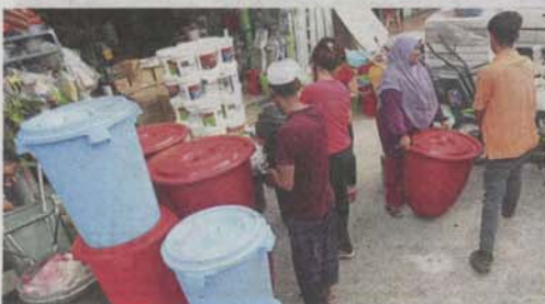
People buying large water containers at Segambut Bahagia, Kuala Lumpur, to prepare for the four-day water disruption.

Food operators will use takeaway containers when serving food, even to those dining in.