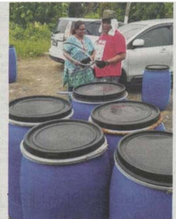
JUALAN tong mula laris sejak minggu lalu.