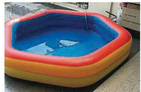
孩童嬉戲的塑膠泳池在制水期間派上用場，足以存儲供家居用戶使用一時的用水量。